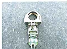
Mクランプ48*48 (峰や肩に)