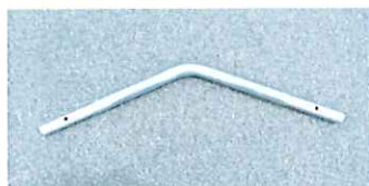
差込式ジョイント (峰用 肩用)